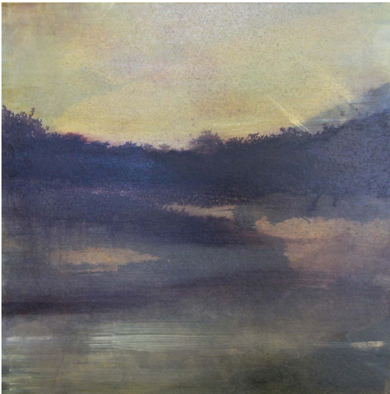
Série «Du versant de l'ombre», technique mixte, 50x50cm © Anne-Laure H-Blanc